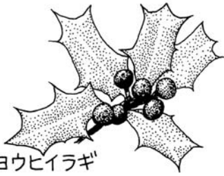
セイヨウヒイラギ