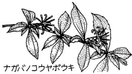
ナガバノコウヤボウキ