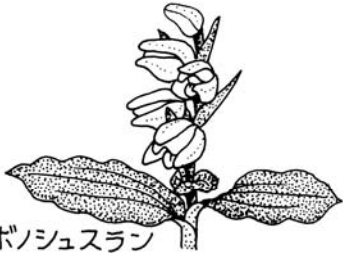
アケボノジュスラン