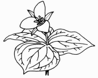
オオバナノエンレイソウ

セールスのこころ12カ月 ―あんないい話 こんないい話 88 “小さいが超大きい”サービス 49