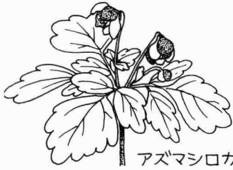
アズマシロカネソウ