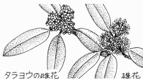
タラヨウの雌花 雄花