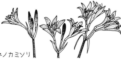
キツネノカミノリ