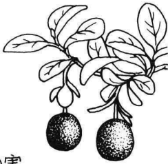
クロマメノキの実