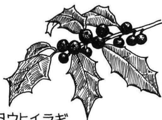
セイヨウヒイラギ